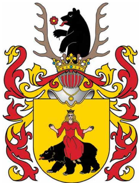
Rawicz - polski herb szlachecki

Włodarzowanie Grota nie trwało długo. Najstarszy zachowany dokument z dziejów miasta nosi datę 1473 i informuje o przekazaniu dzierżawy Dominikowi Ka-