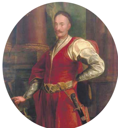
Stanisław Antoni Szczuka

Stanisław Antoni Szczuka (1654-1710) kolejny ważny właściciel Radzyna to postać świetlana. Był sekretarzem, ale także doradcą i przyjacielem Jana III Sobieskiego, uczestniczył w odsieczy wiedeńskiej (1683). Paweł Jasienica nazywa go „najmądrzejszym i najlepszym człowiekiem epoki”. Był kreatorem życia politycznego, wybitnym pisarzem politycznym i mówcą