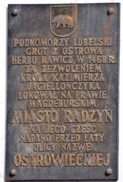
Nadanie praw miejskich Radzyń zawdzięcza Grotowi z Ostrowa, o czym przypomina pamiątkowa tablica na ul. Ostrowieckiej