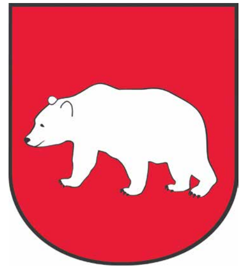
Herb Radzynia Podlaskiego

Niedźwiedź w herbie towarzyszy naszemu miastu od zarania – choć nie zawsze był taki jak obecnie. Wszak założyciel miasta - Grot z Ostrowa pieczętował się herbem Rawicz, który przedstawiał pannę na niedźwiedziu. W zmienionej for-