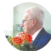
Koniec roku szkolnego