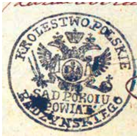
4. Pieczęć Sądu Pokoju powiatu radzyńskiego, Odcisk w tuszu; Źródło: APL O/Radzyna, Hipoteka w Radzynie Podlaskim, sygn. III/377, str. 61.

Oficjalny herb Królestwa Kongresowego znalazł się więc na pieczęciach urzędów centralnych oraz administracji lokalnej. Na wystawie prezentowane są odciski stempli stosowanych przez władze miasta Radzyna, władze sądowe oraz urzędników na terenie powiatu radzyńskiego. Legendy pieczęci w Królestwie Polskim przekazywały dwie informacje, o dysponencie pieczęci i przynależności administracyjnej. (Ilustracja 4)