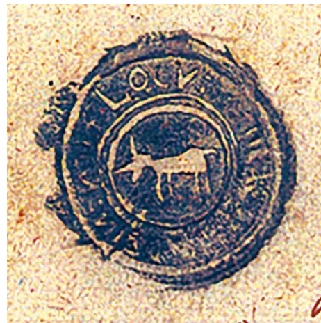
1. Pieczęć miasta Radzyna z XVIII wieku, odcisk w tuszu oraz przez papier; Źródło: APL/ORadzyń, Akta notariusza Franciszka Lubańskiego w Radzynie Podlaskim, sygn. 3, str. 492;

Okres przypadający na koniec wieku XVIII, po Sejmie Czteroletnim, to lata, kiedy legendy pieczęci pisano w języku polskim. W Radzynie wciąż jednak posługiwano się dawną pieczęcią. Pochodzące z 1798 i 1799 r. odciski pieczętnie są tego dowodem.