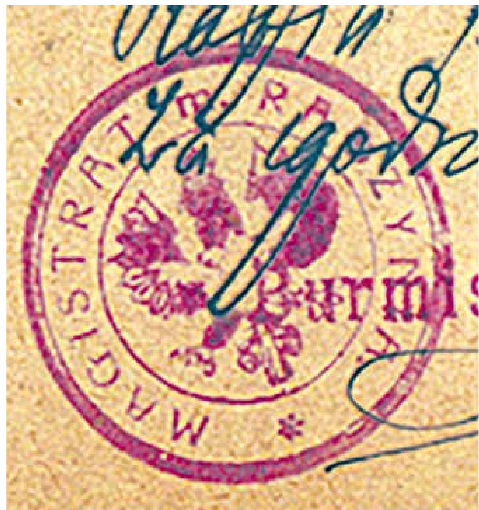
7. Pieczęć Magistratu miasta Radzyna, rok 1921, Odcisk w tuszu; Źródło: APL O/Radzyna, Hipoteka w Radzynie Podlaskim, sygn. III/436, str. 56.