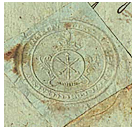
2. Pieczęć Dominium Radzyńskiego z okresu zaboru austriackiego, Odcisk przez papier