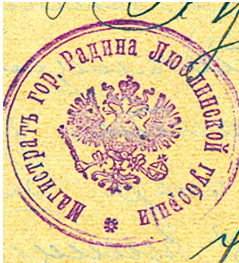
6. Pieczęć Magistratu miasta Radzyna guberni lubelskiej, rok 1915, Odcisk w tuszu; Źródło: APL O/Radzyna, Akta notariusza Władysława Karwowskiego w Radzynie Podlaskim, sygn. 82, str. 315.