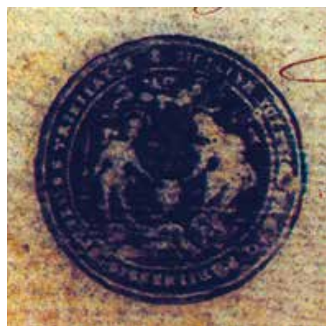
8. Pieczęć Parafii p.w. Świętej Trójcy w Radzynie, rok 1833; Źródło: APL O/Radzyna, Hipoteka w Radzynie Podlaskim, sygn. II/99, str. 32.

Na wystawie prezentowane są odciski pieczęci Radzyna i okolicznych gmin, urzędów i urzędników z XVIII, XIX i XX wieku. Prezentowane pieczęcie pochodzą przede wszystkim z dziewiętnastowiecznych akt notarialnych i hipotecznych z terenu powiatu radzyńskiego. Uzupełnieniem są tu akta miejskie wytworzone przez Magistrat w Radzynie w okresie 1918-1939.