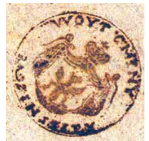
3. Pieczęć Wójta Gminy Radzyna, Odcisk w tuszu; Źródło: APL O/R, Akta notariusza Jana Saryusza Mnińskiego w Radzynie Podlaskim, sygn. 1, str. 493.

Z okresu Księstwa Warszawskiego pochodzi również pieczęć Wójta Gminy Radzyńskiej. Zachowany wizerunek pochodzi z dokumentu z 1815 r. W przypadku urzędów miejskich stemple stosowane w okresie Księstwa Warszawskiego posiadały wyobrażenie Orła Białego. Funkcjonowały również znaki przedrozbiorowe. W przypadku pieczęci gminy radzyńskiej herb przedstawiał Orła ułożonego na płaszczu herbowym zwieńczonym zamkniętą koroną. (Ilustracja 3) Wspomniany znak obowiązywał prawdopodobnie od początku istnienia Księstwa do czasu powstania Królestwa Kongresowego.