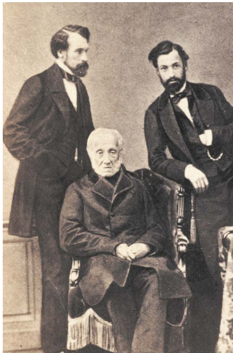
Książę Adam Jerzy Czartoryski z synami