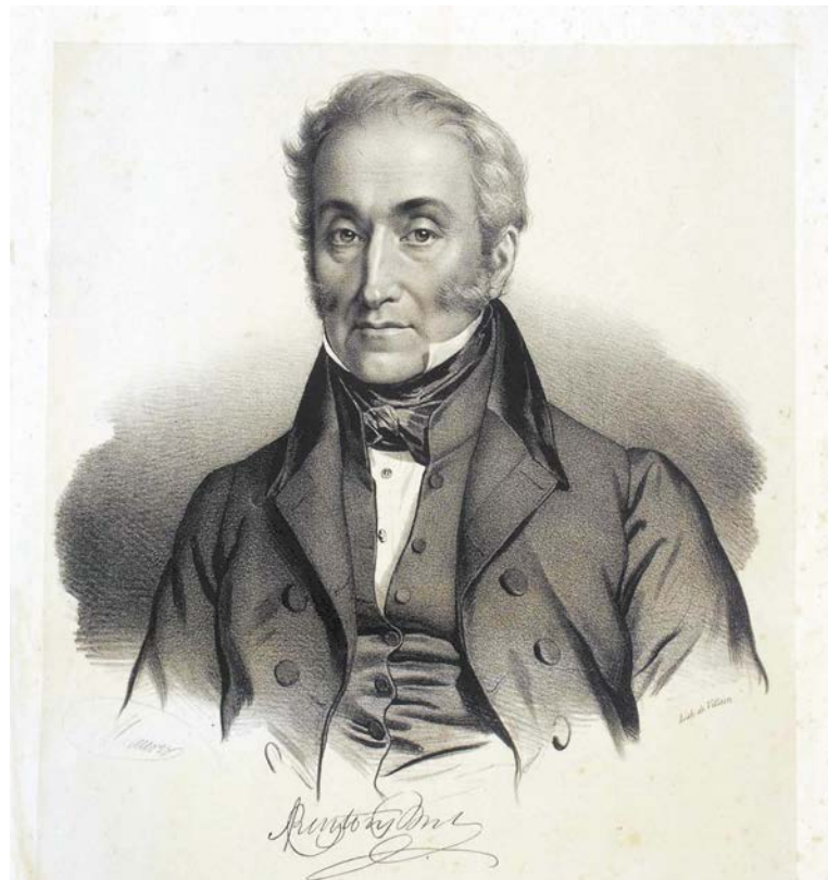
Książę Adam Jerzy Czartoryski