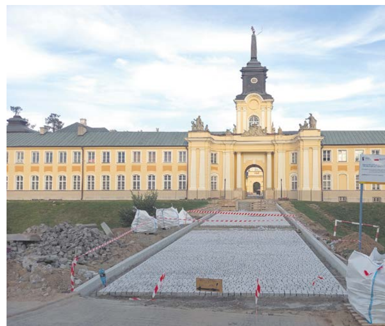
Powstaje droga łącząca ul. Jana Pawła II z bramą zachodnią Pałacu Potockich.