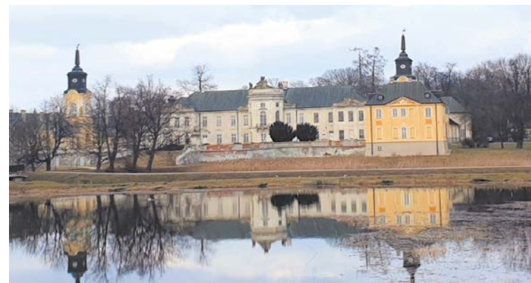
Na fot. stan stawów w 2021 roku, po mroźnej zimie, gdy powstała gruba warstwa lodu, co umożliwiło pracownikom wejście na grubą taflę i wykoszenie trzcin.