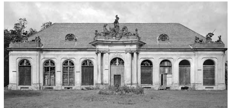
Pałacowa oranżeria (1933 r.)

Ale Towarzystwo nie rozporządza takimi środkami finansowymi, aby tak wielką rzecz stworzyć własnymi siłami. Całe społeczeństwo powiatu, jako zainteresowane przyszłym miejscem ich „strawy duchowej”, musi w tym dziele dopomóc.