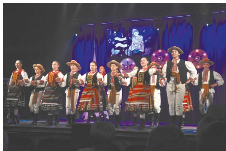
Red.; Fot. Tomasz Młynarczyk