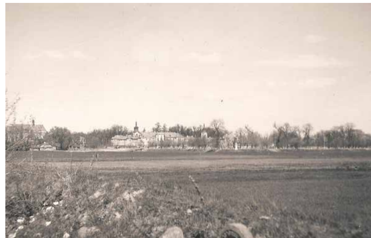
Widok ze starego cmentarza żydowskiego na pałac Potockich, u dołu znajdują się macewy (okres międzywojenny)