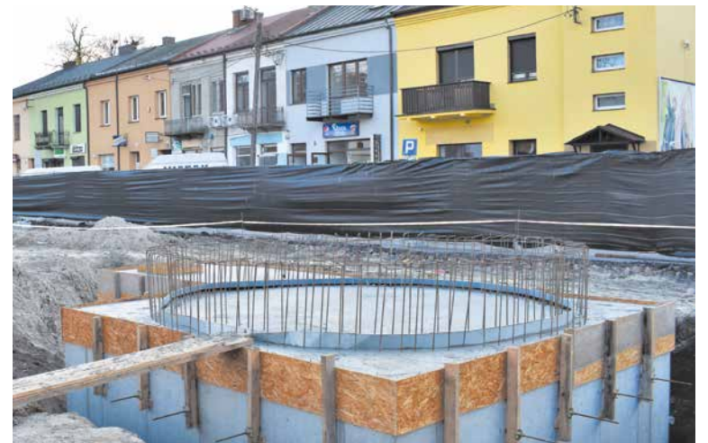
Na rewitalizowanym Rynku jest budowana fontanna