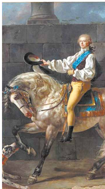
Stanisław Kostka Potocki

dzieła sztuki i książki pochodzące z radzyńskiego pałacu?