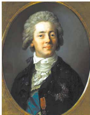
Stanisław Kostka Potocki