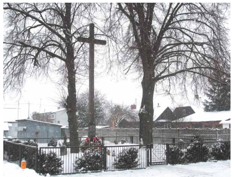
Mogiła Powstańców Styczniowych w 1935 i 2020 r.

nikach widoczne są słupki-znicze. Po bokach rosną dwie okazałe lipy, a całość jest ogrodzona metalowym płotkiem z furtką od przodu. Wymieniony został też krzyż, do którego przymocowana jest nowa tabliczka. Zobaczmy na niej czarny krzyż, liść palmowy oraz napis: „Ś. P. / POLEGŁYM ZA WOLNOŚĆ BOHATEROM POWSTANIA / 1863 r. / NA MIEJSCU STRACENIA i TU POCHOWANYM / 1. PYRKOSZ MARCIN LAT 37 DN. 23.I.1863 r. / 2. MOTYCZYŃSKI KAROL LAT 38 DN. 23.I.1863 r. / 3. DREWNOWSKI STEFAN LAT 27 DN. 6.I.1863 r. / 4. KRASOWSKI RAJMUND LAT 25 DN. 6.I.1863 r. / i INNI NIEZNANI / Cześć Ich Pamięci /”. Tabliczka stanowi odwzorowanie oryginału z okresu międzywojennego. Zawiera jednak dwa błędy – w przypadku daty