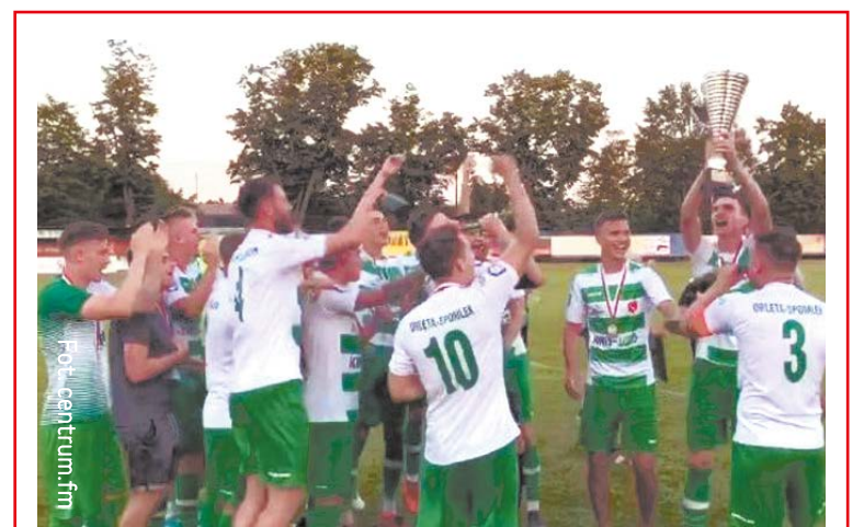
Tak cieszyli się Orleńscy 29 lipca po zwycięskim meczu z Chetmianką Chetm (2:0), który dał radzyńskiej drużynie awans do 1/32 finału Pucharu Polski