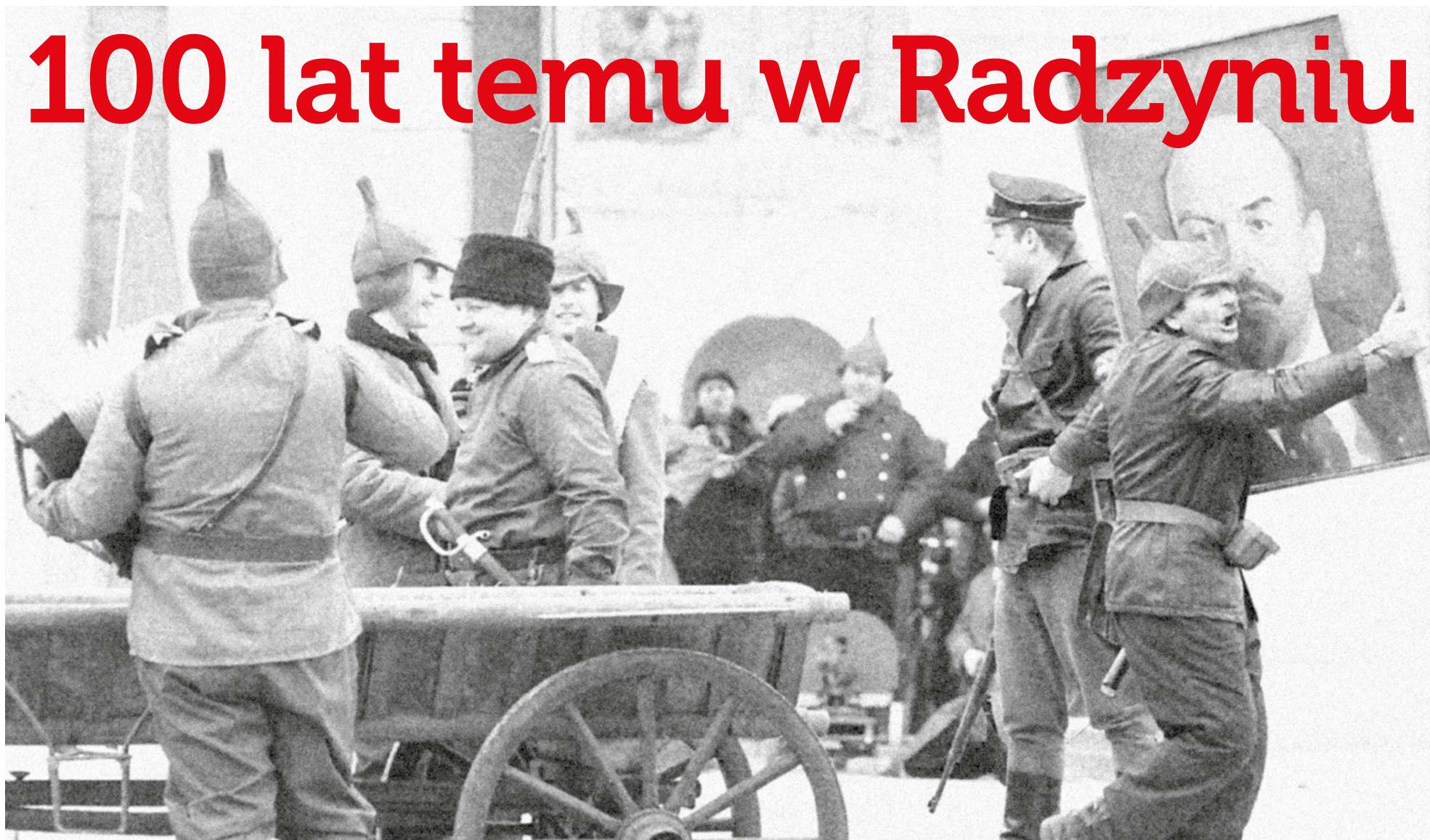
Fotografia pochodzi z rekonstrukcji historycznej, jaka miała miejsce w Radzynie w 2007 r.