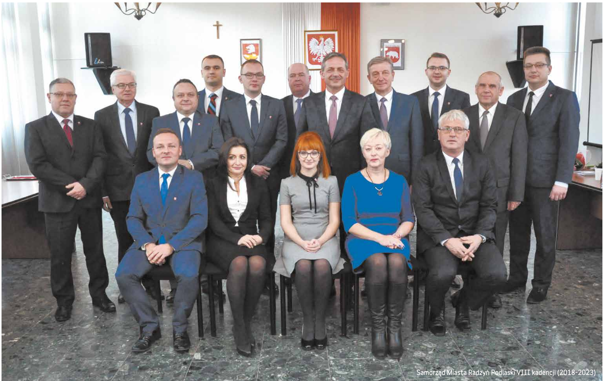
Samorząd Miasta Radzyń Podlaski VIII kadencji (2018-2023)