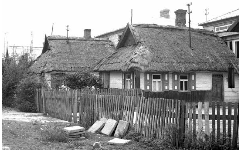
Zabudowa ul. Podlaskiej w Radzynie (lata 80-te XX w.)