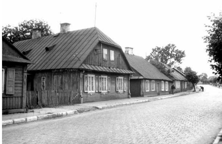
Drewniana zabudowa ul. Warszawskiej (lata 80-te XX w.)