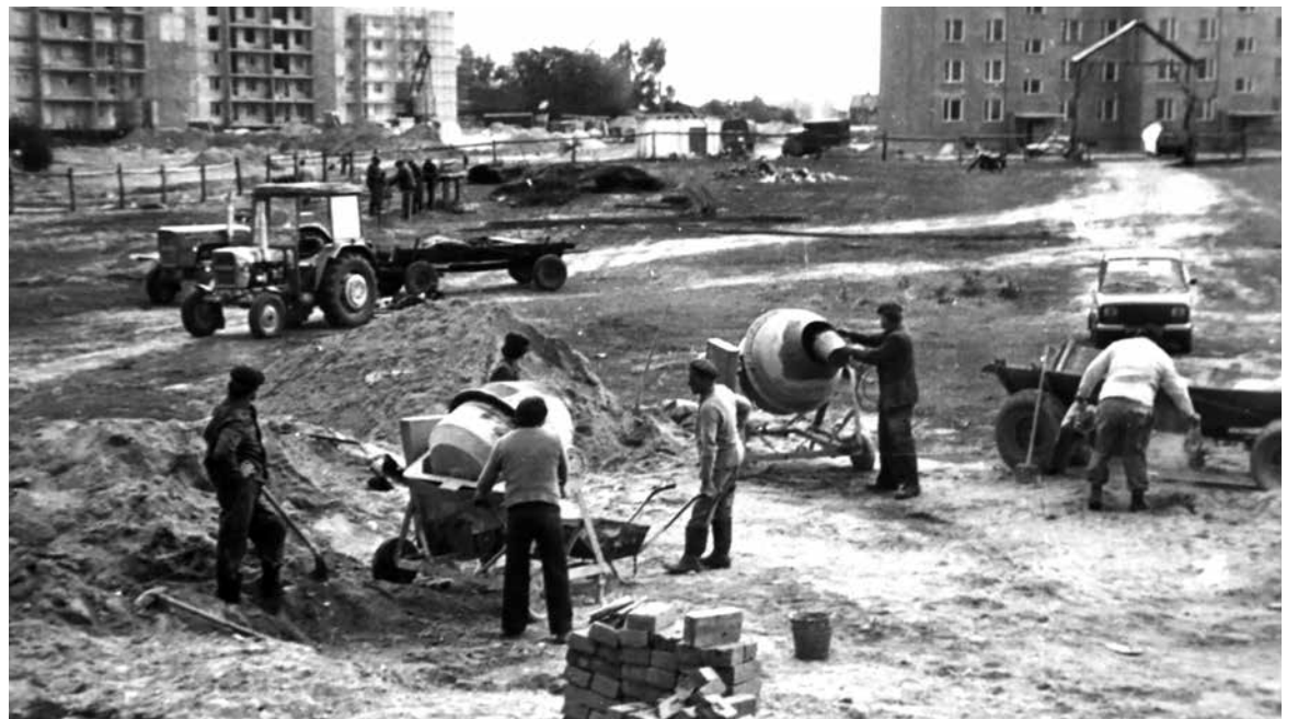
Budowa kościoła przy ul. Kardynała Stefana Wyszyńskiego (1984 r.)