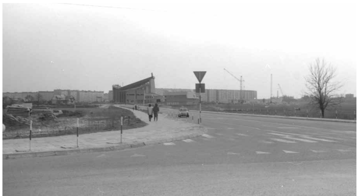
Skrzyżowanie ul. Warszawskiej z ul. Kardynała Stefana Wyszyńskiego (lata 80-te XX w.)