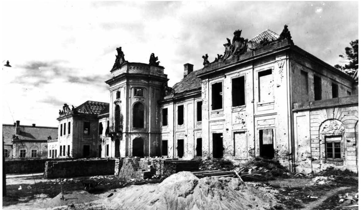
Pałac Potockich w Radzynie tuż po wojnie (1945 r.)