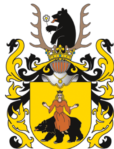
Rawicz - herb założyciela Radzyna Grota z Ostrowa