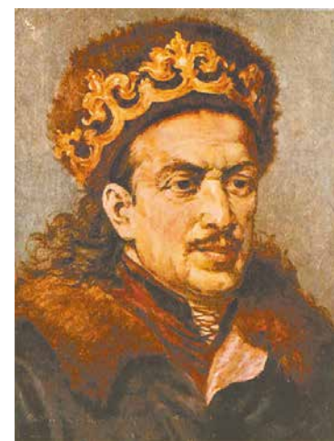
Kazimierz Jagiellończyk, który nadał Radzynie Prawa miejskie

Warto podkreślić, że w historii miasta pojawiły się też inne mo-