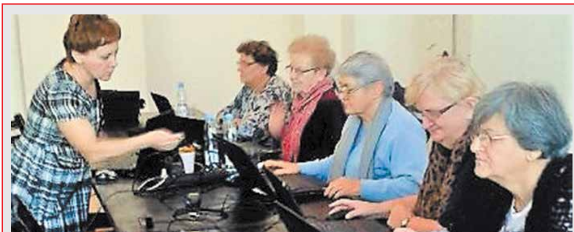
Ruszył projekt „Czas dla Seniorów”, w ramach którego 32 seniorów uczestniczy w zajęciach wokalnych, komputerowych i terapii zajęciowej.