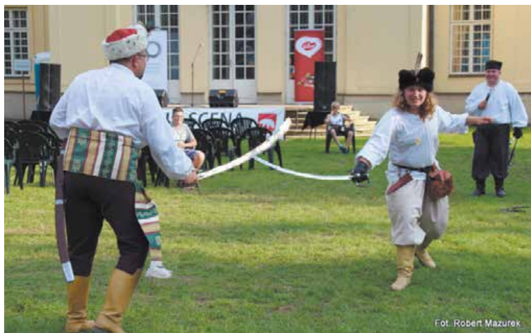
Fot. Robert Mazurek