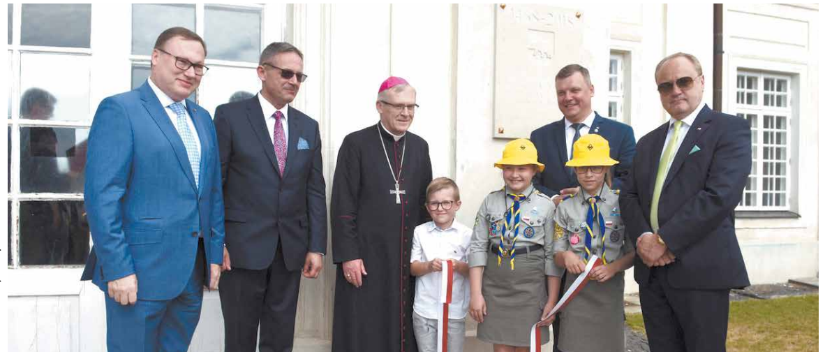
Fot. Tomasz Młynarczyk