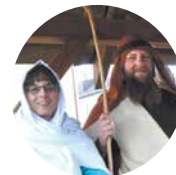
V Orszak Trzech Króli w Radzynie