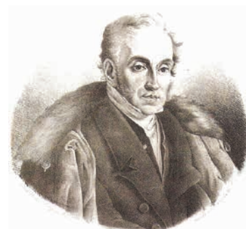
Adam Jerzy Czartoryski

biegów majątkowych między innymi w 1834 roku sprzedała Radzyn rodzinie Szlubowskich .