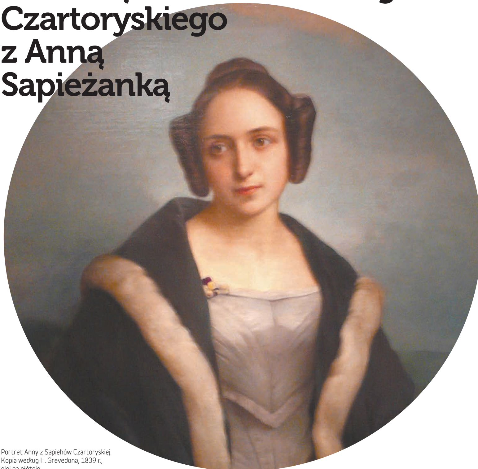
Portret Anny z Sapiehów Czartoryskiej. Kopia według H. Grevedona, 1839 r., olej na płótnie.