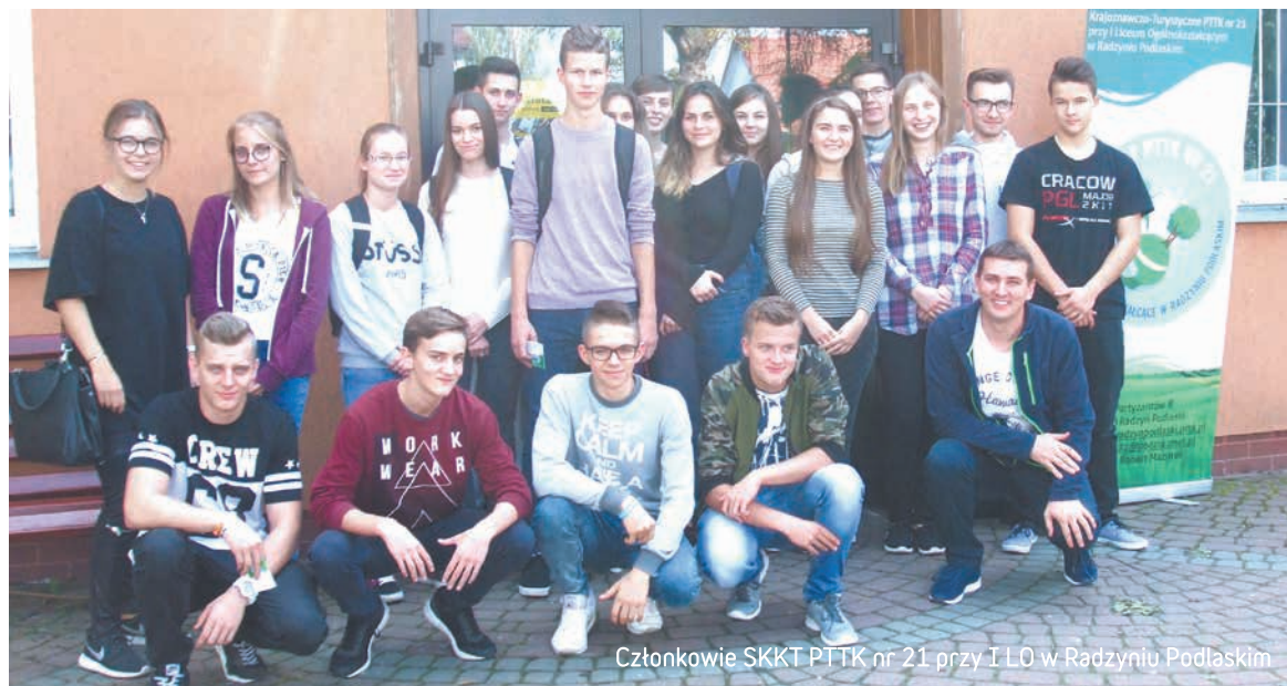
Członkowie SKKT PTTK nr 21 przy I LO w Radzynie Podlaskim