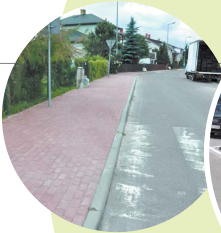
Budowa ul. Baczyńskiego, Rey- monta, Lisowskiego - poprawa układu komunikacyjnego.