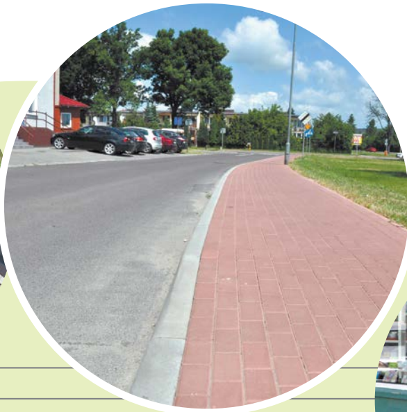
Budowa chodnika ul. Wybickiego.