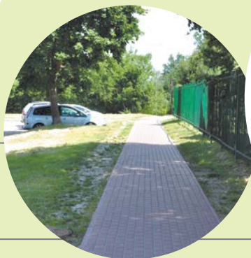
Dojście do Gimnazjum nr 2.