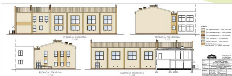
Sala gimnastyczna przy SP nr 2