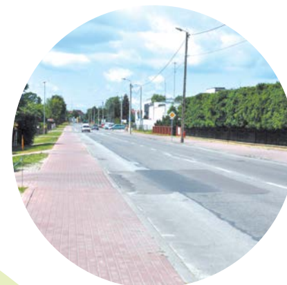
Budowa chodnika na ul. Warszawskiej.