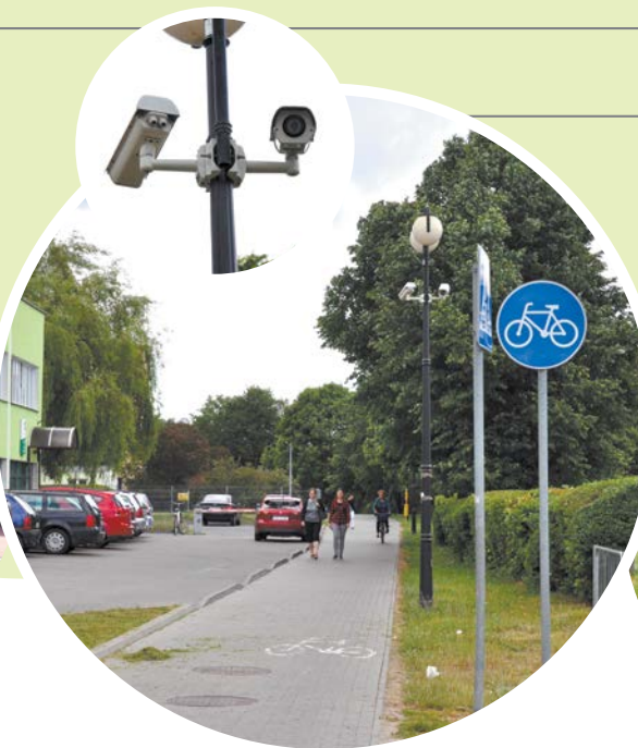
Przebudowa monitoringu na ścieżce rowerowej.