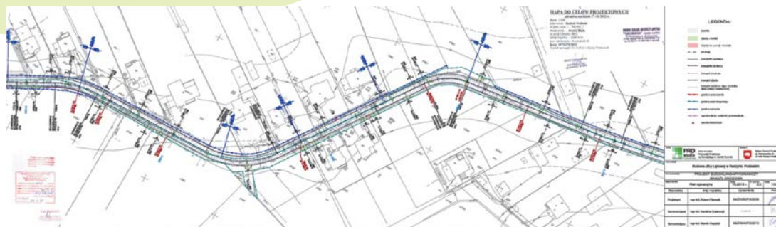
Projekt ul. Łąkowej (aktualizacja)