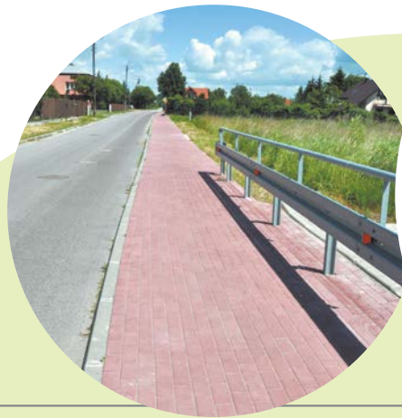
Budowa ulic Truskawkowej, Poziomkowej i Wiśniowej.