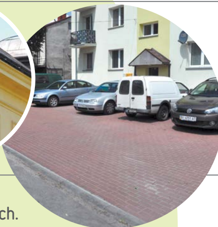
Utwardzenie powierzchni gruntu na działce przy ul. Warszawskiej.