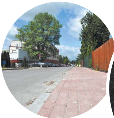
Budowa chodnika na ul. Partyzantów.