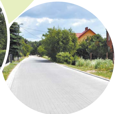
Przebudowa ul. Nadwitnie