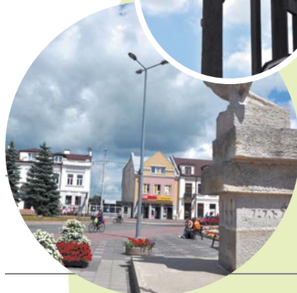
Monitoring pl. Potockiego i ul. Wyszyńskiego.