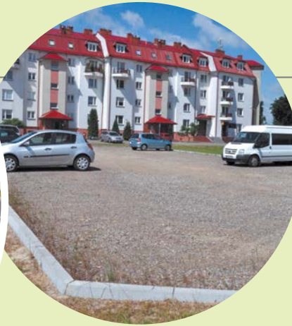
Utwardzenie działki przy ul. Wybickiego.