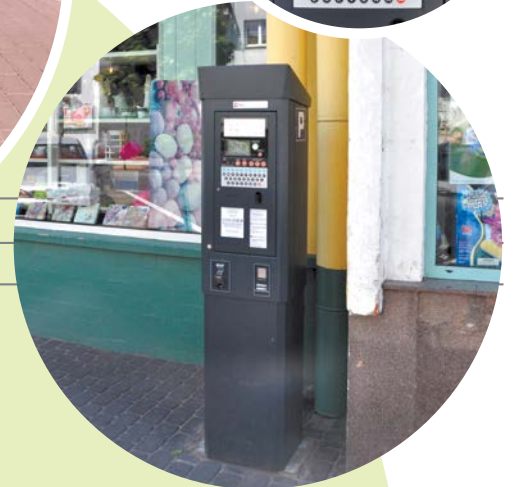
Zakup nowego parkometru.