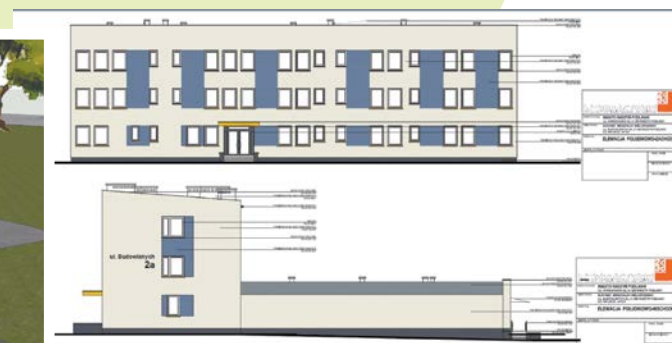
Adaptacja budynku przy ul. Budowlanych na potrzeby mieszkań socjalnych.