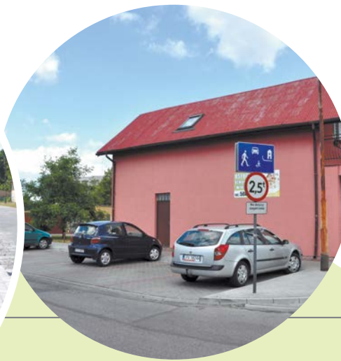
Budowa chodnika i zatoki postojowej ul. Chmielowskiego.