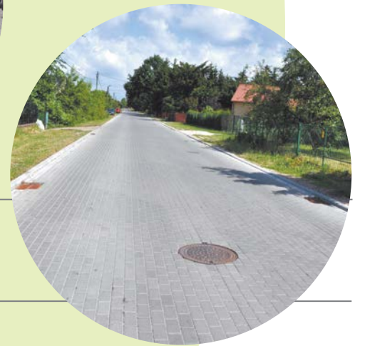
Przebudowa ul. Płudzińskiej.