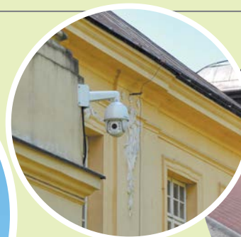
Monitoring Pałacu Potockich.