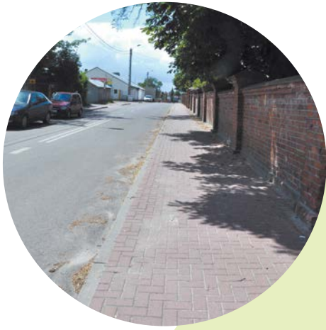
Budowa ul. Zielonej, Dębowej, Akacyjowej, Klonowej, Powstania Styczniowego.